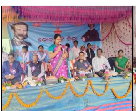
Govt. (New) Gangadhar Nodal High School, Kusumi, Koraput