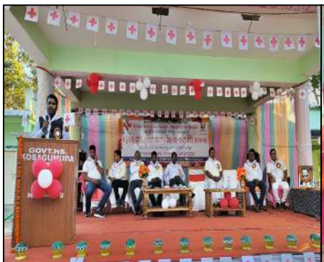
Govt. High Scholl, Kosagumada,Nabarangapur