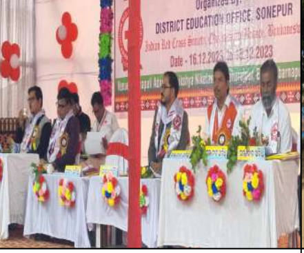
GanapatiAdarshaShikshyaNiketan, Biramaharajpur, Sonepur