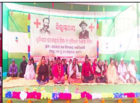
Govt. High School, Bangiriposi, Mayurbhanj