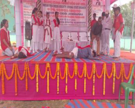
Balukenswar Nodal H S, Balabhadrapur, Kendrapara