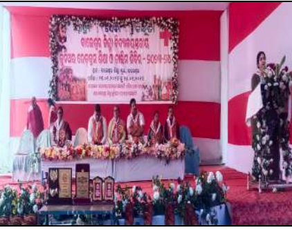
Zilaa High School, Balasore