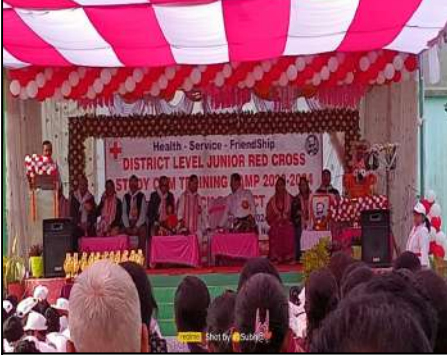
Sikharpur Nodal HS, Khandapada, Nayagarha