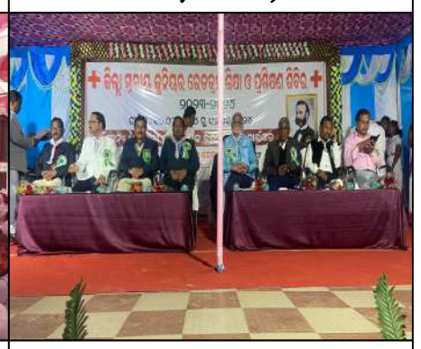
Govt. Girls High School, Banaigada, Sundargada