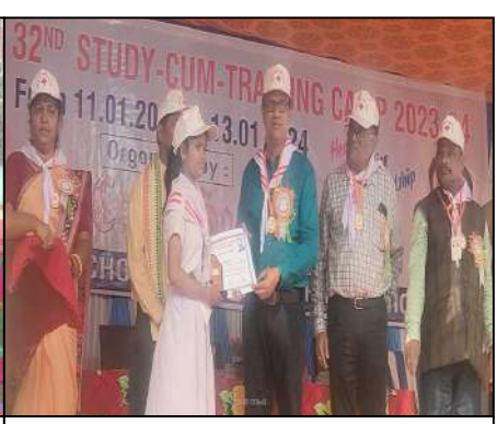
Govt. HS Balugan, Khurdha