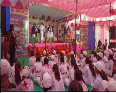
Harekrushna Mahatab High School, Balangir