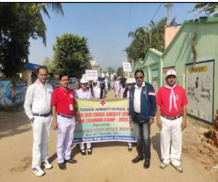
Bapuji Govt. High School, Daincha, Sambalpur